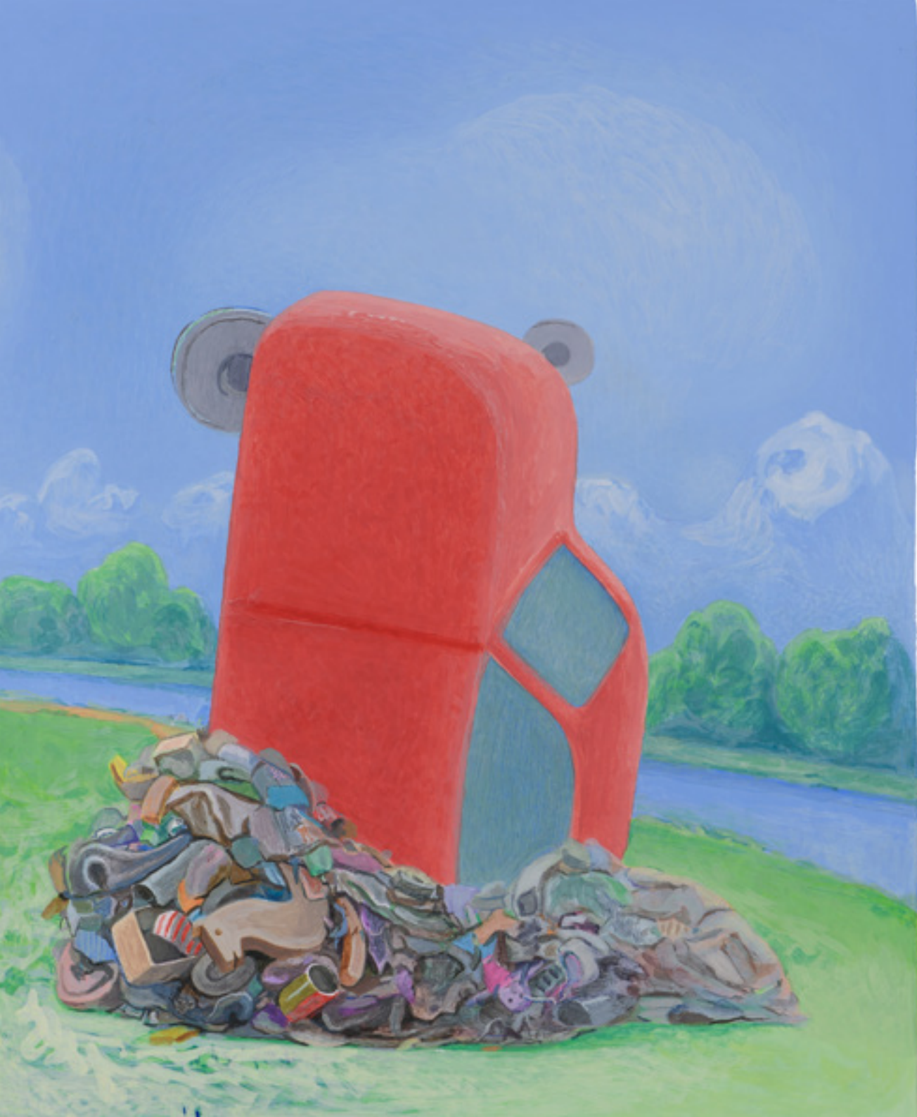
Humain, véhicule et tas, 2024, 35x25cm