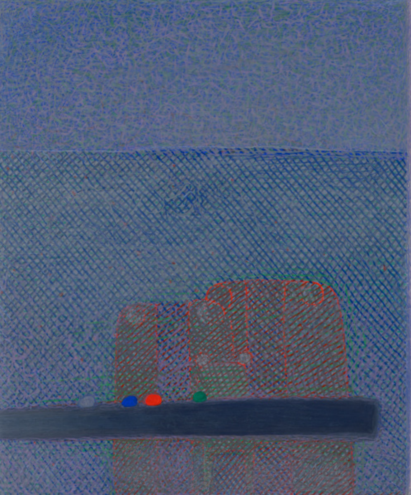
Famille derrière un grillage et route , 2018, 40,5x32,5cm