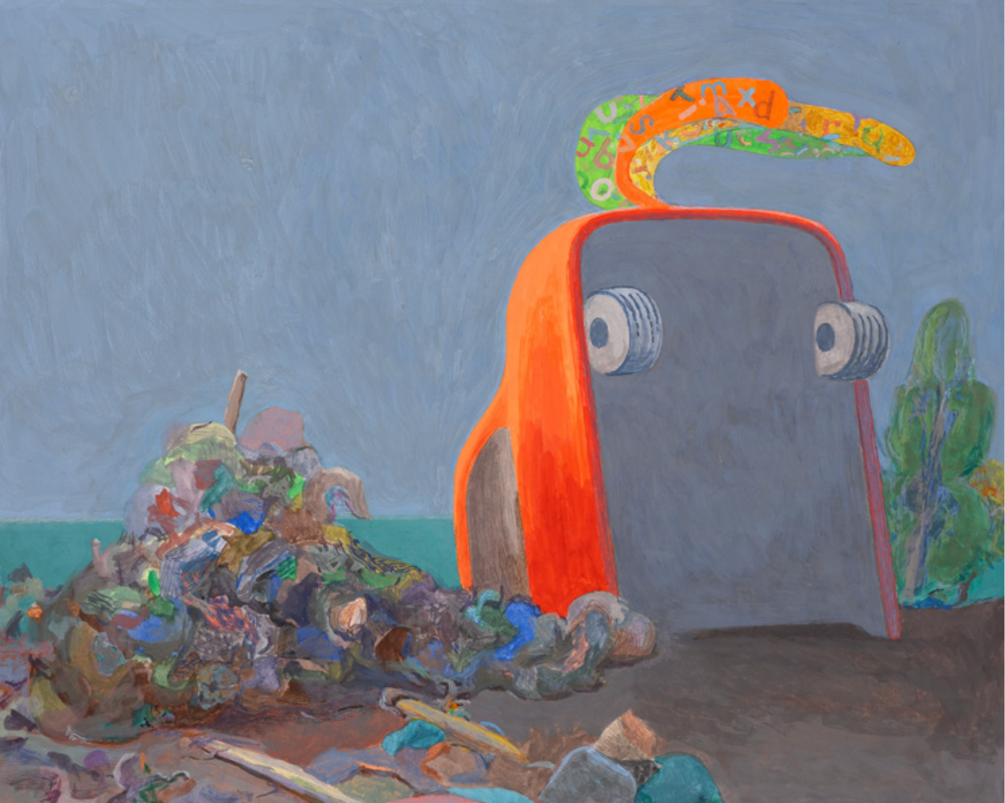
Près d'un tas, 2017, 28x34, 5cm