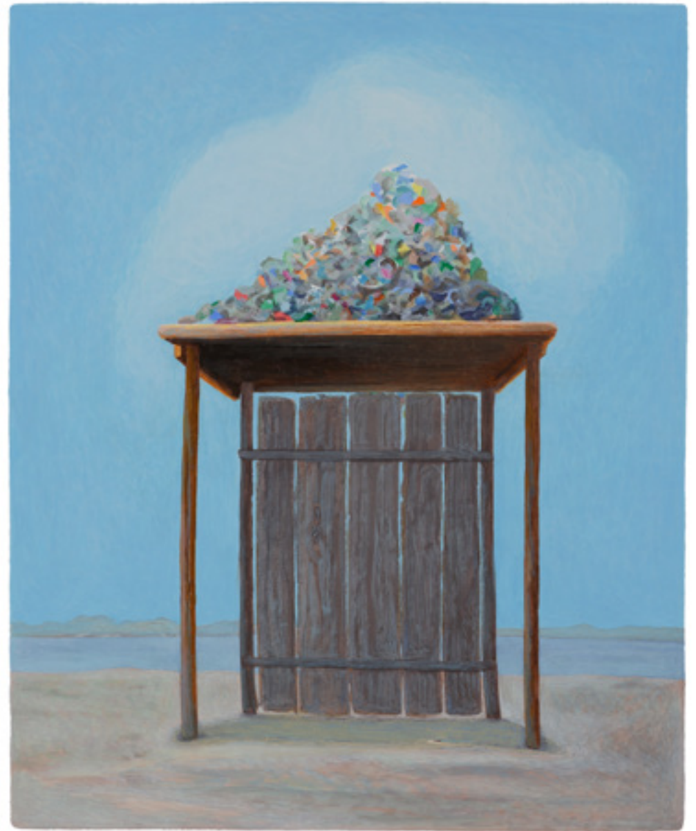
Abri anthroporphe , 2018, 41,7x34cm