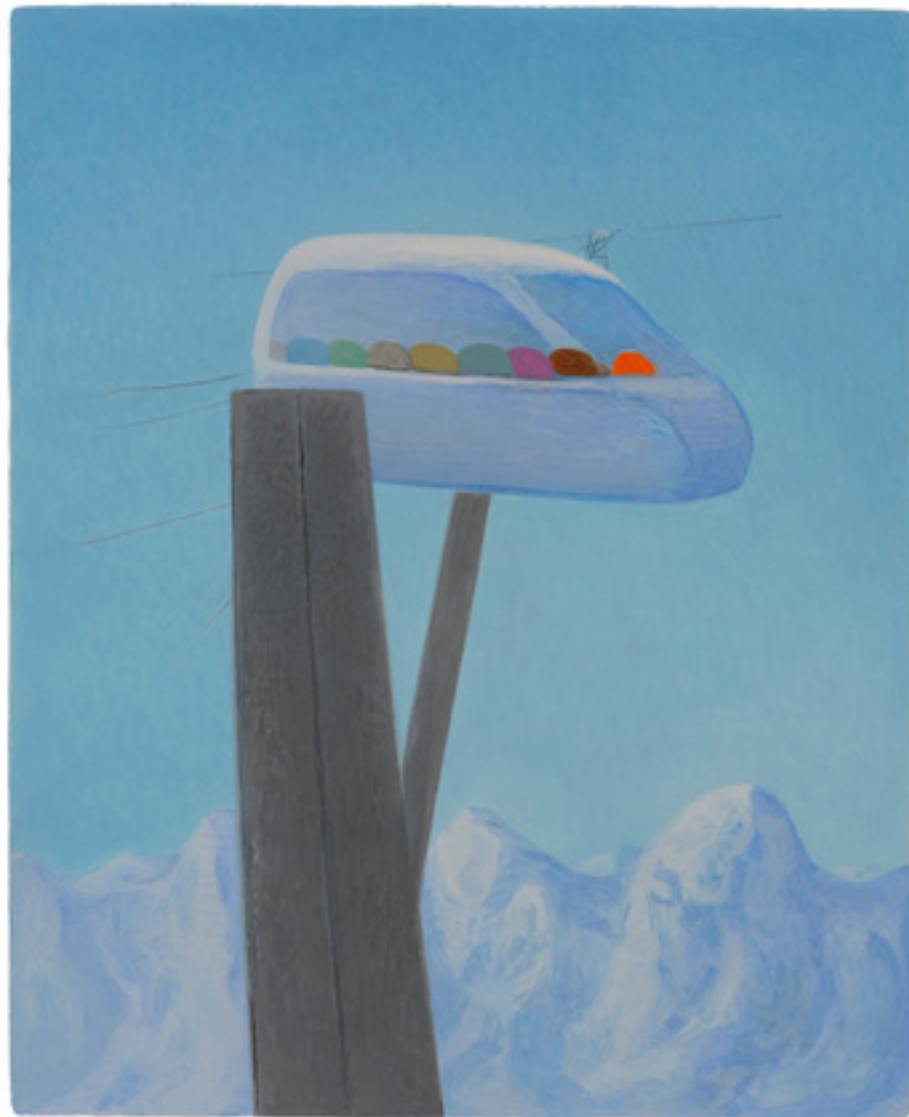
Vers la montagne , 2025, 35x25cm