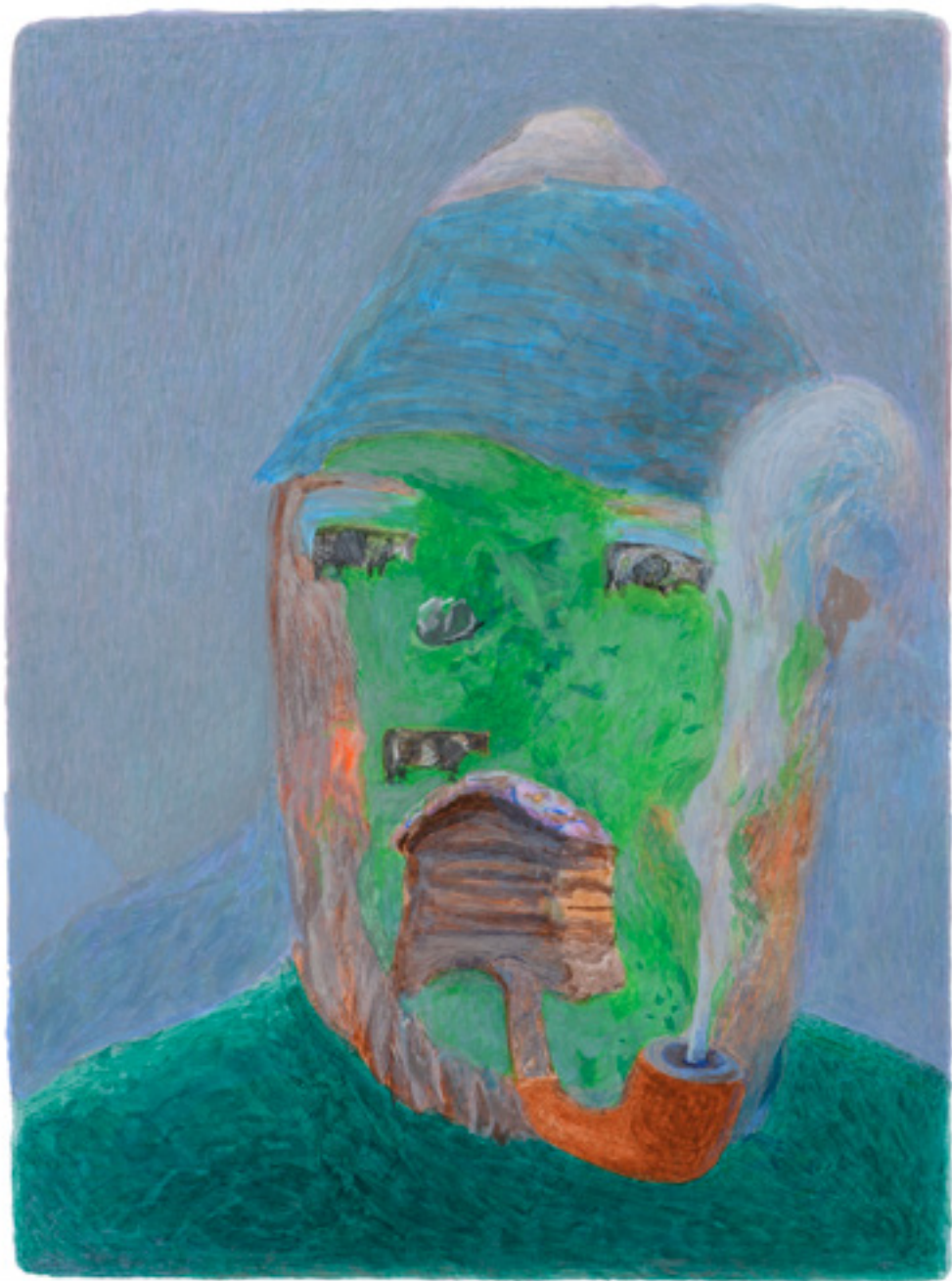
Pâtre , 2017, 32,8x24cm