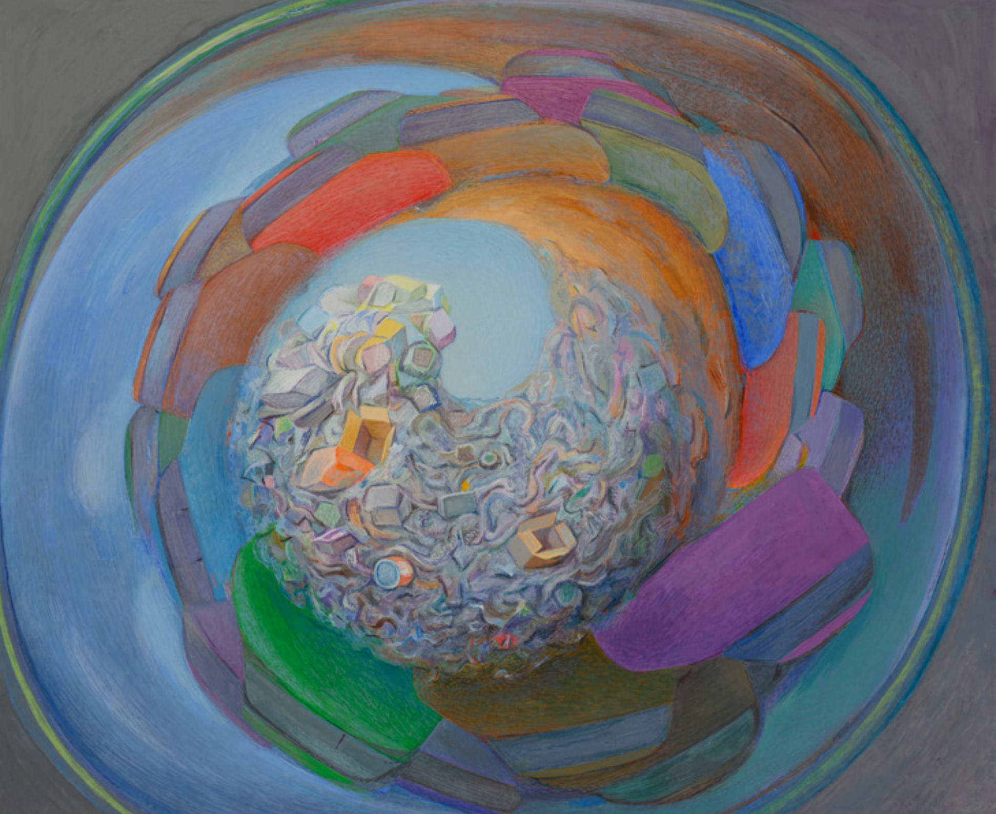
Enjoliveur de roue , 2018, 39x47