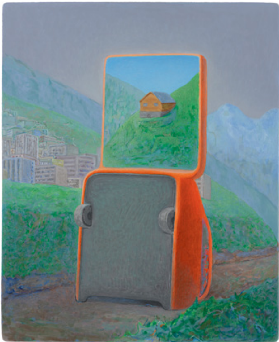
Sans titre , 2018, 40x33cm