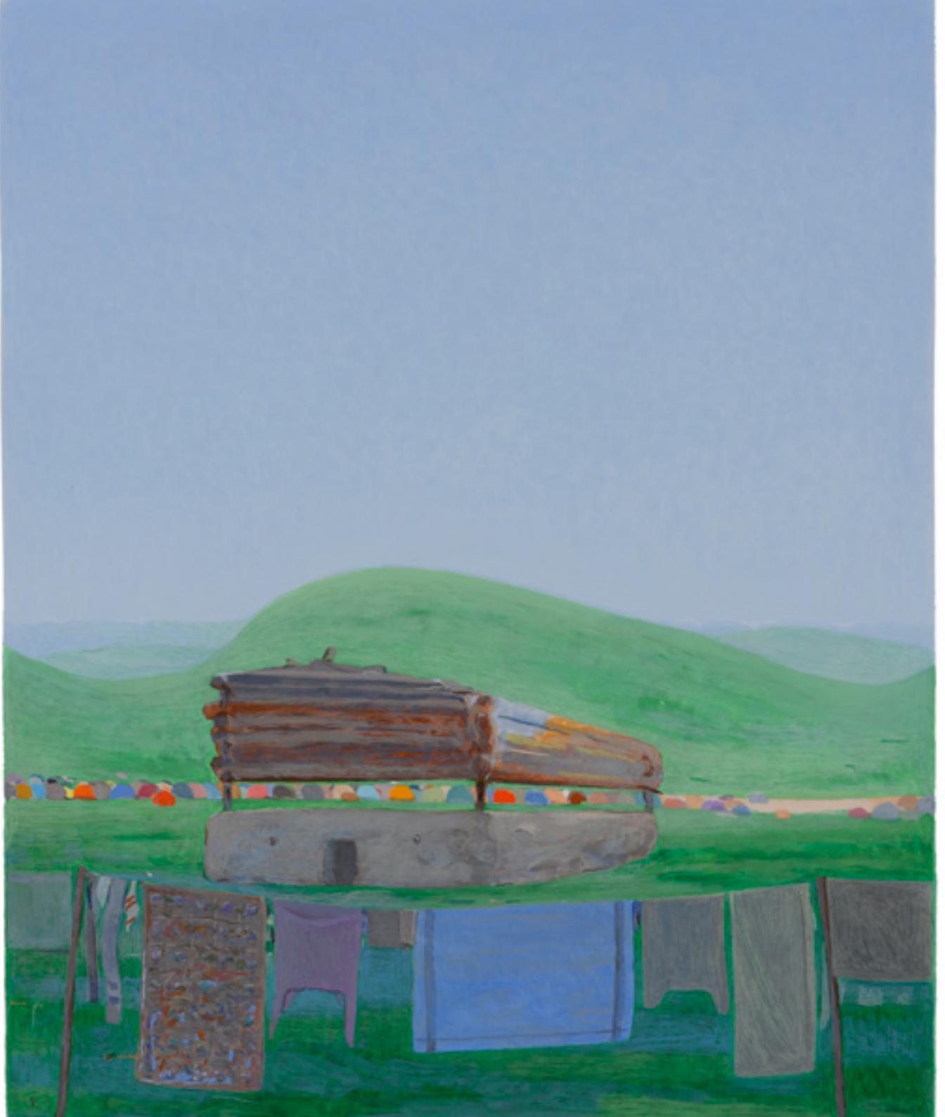
Lessive , 2018, 40x30cm