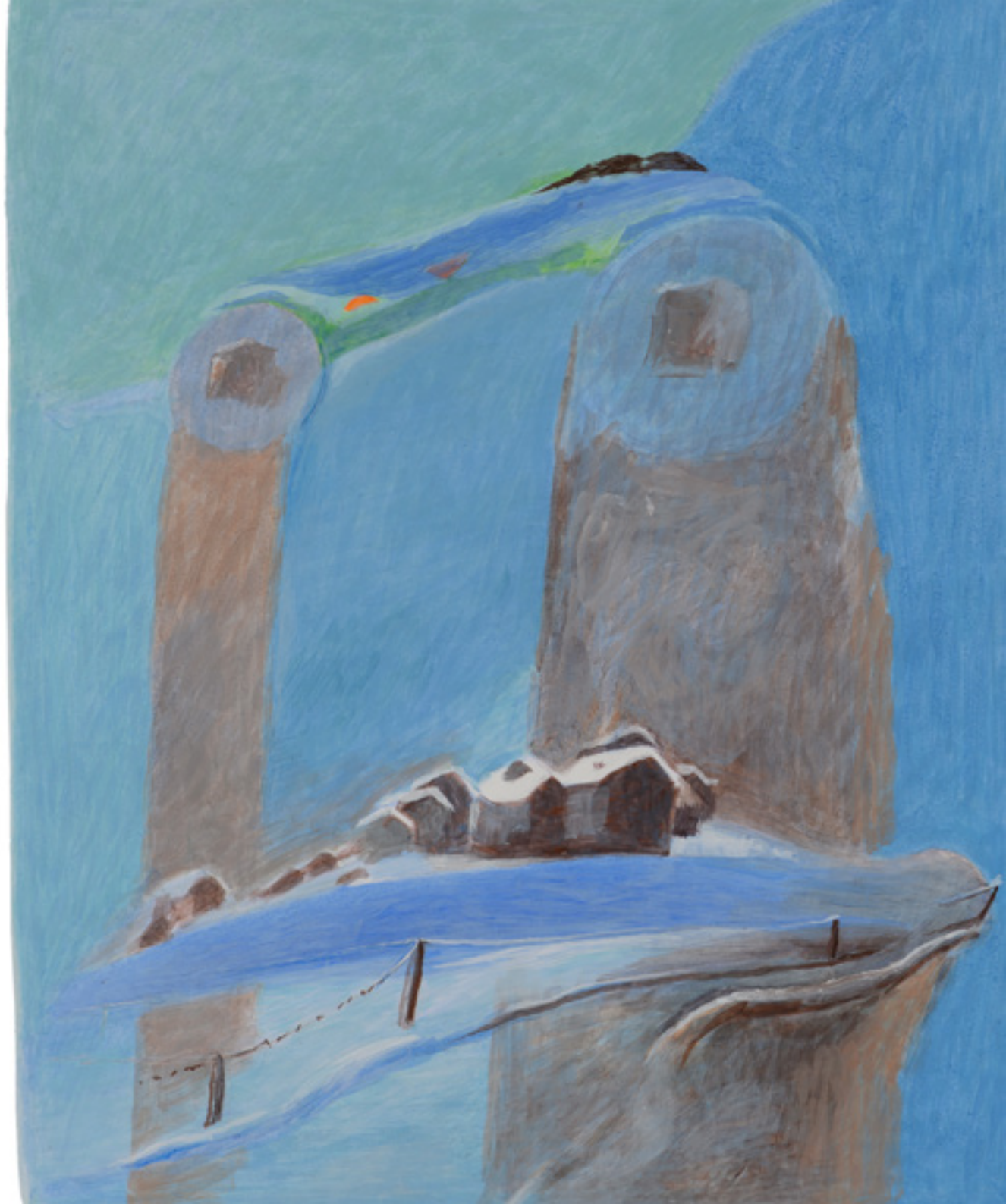
Indigène , 2022, 38x29cm