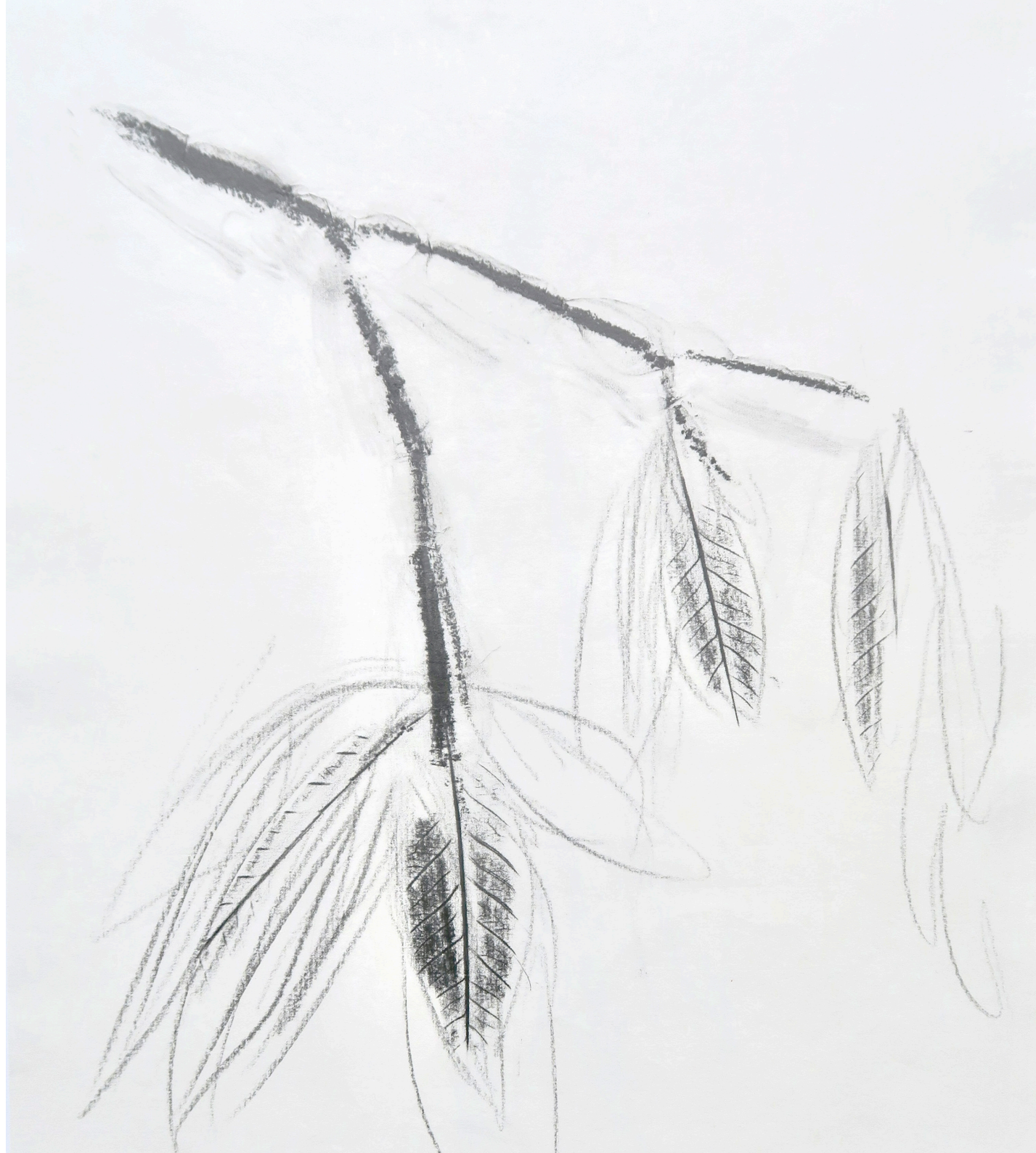
mon cerisier , 2025, crayon sur papier de riz, 45x37 cm