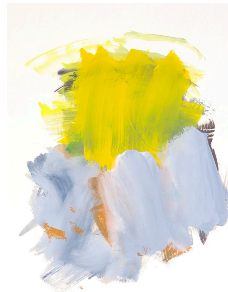
état d'arbre, 2023, aquarelle, crayon couleur sur papier, 32,5x24,5 cm