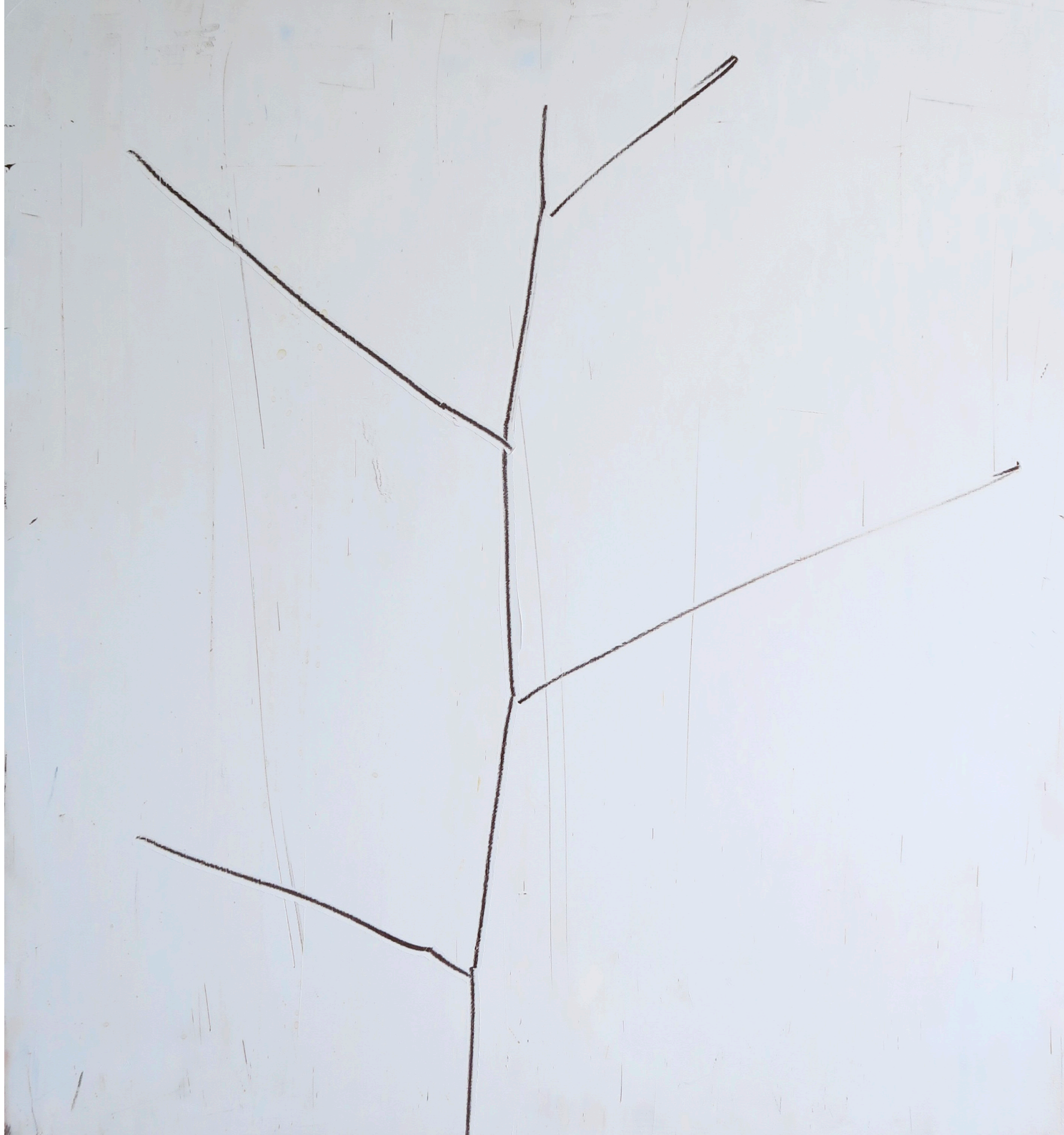
pour la pluie et le vent , 2024, huile sur bois, 64x58 cm