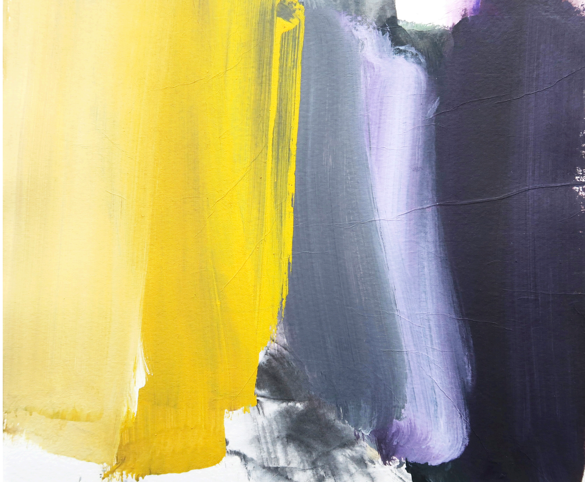
résonnance , 2025, acryl sur papier, 24,5x29 cm