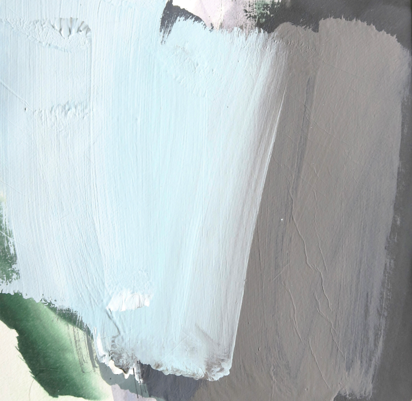
résonnance , 2025, acryl sur papier, 29x29 cm