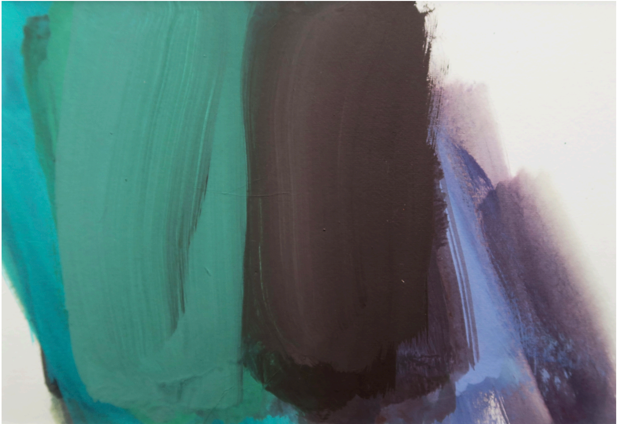
résonnance , 2025, acryl sur papier, 21.5x31.5 cm