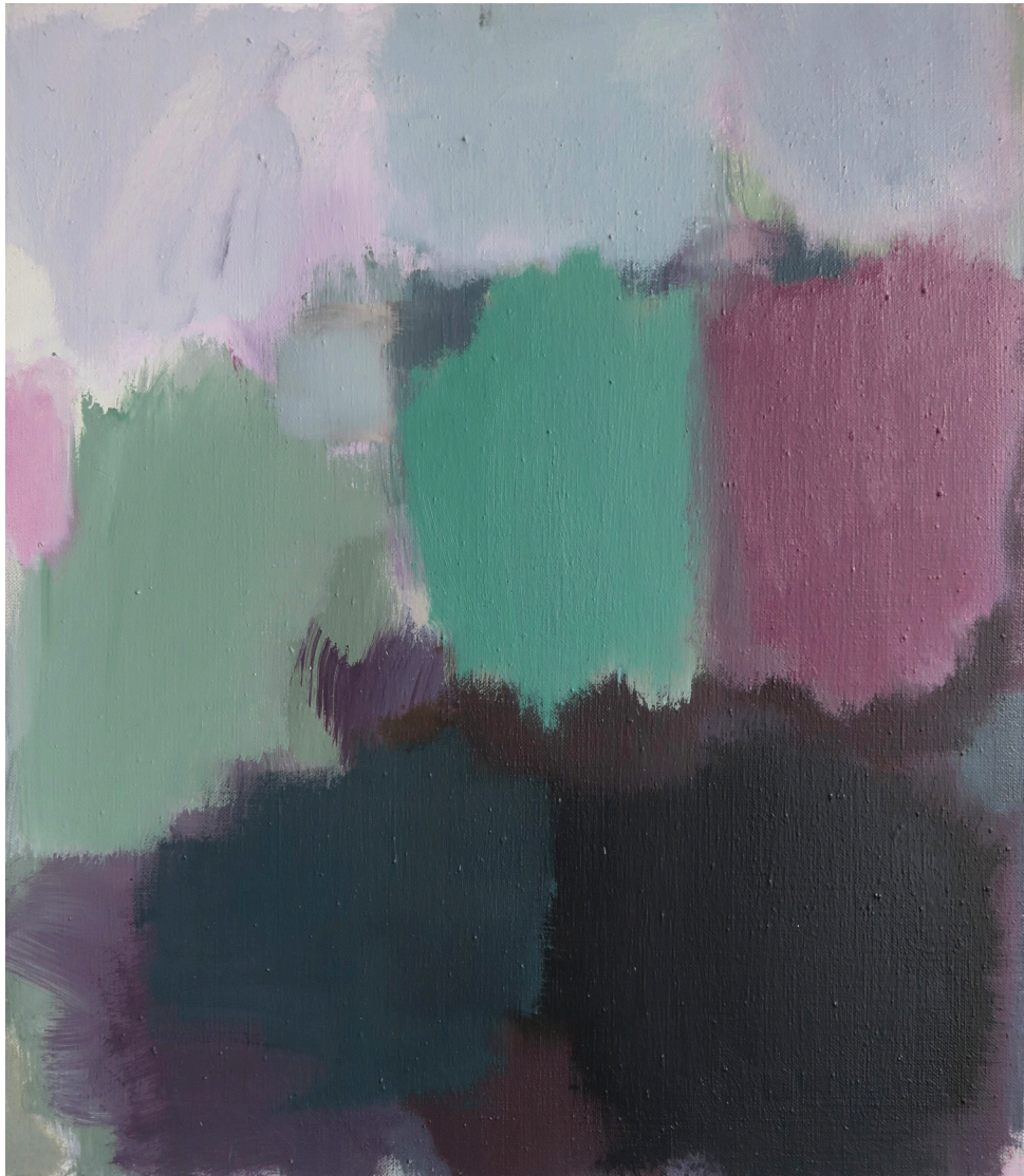
chant de la terre , 2025, huile sur toile, 62x54 cm