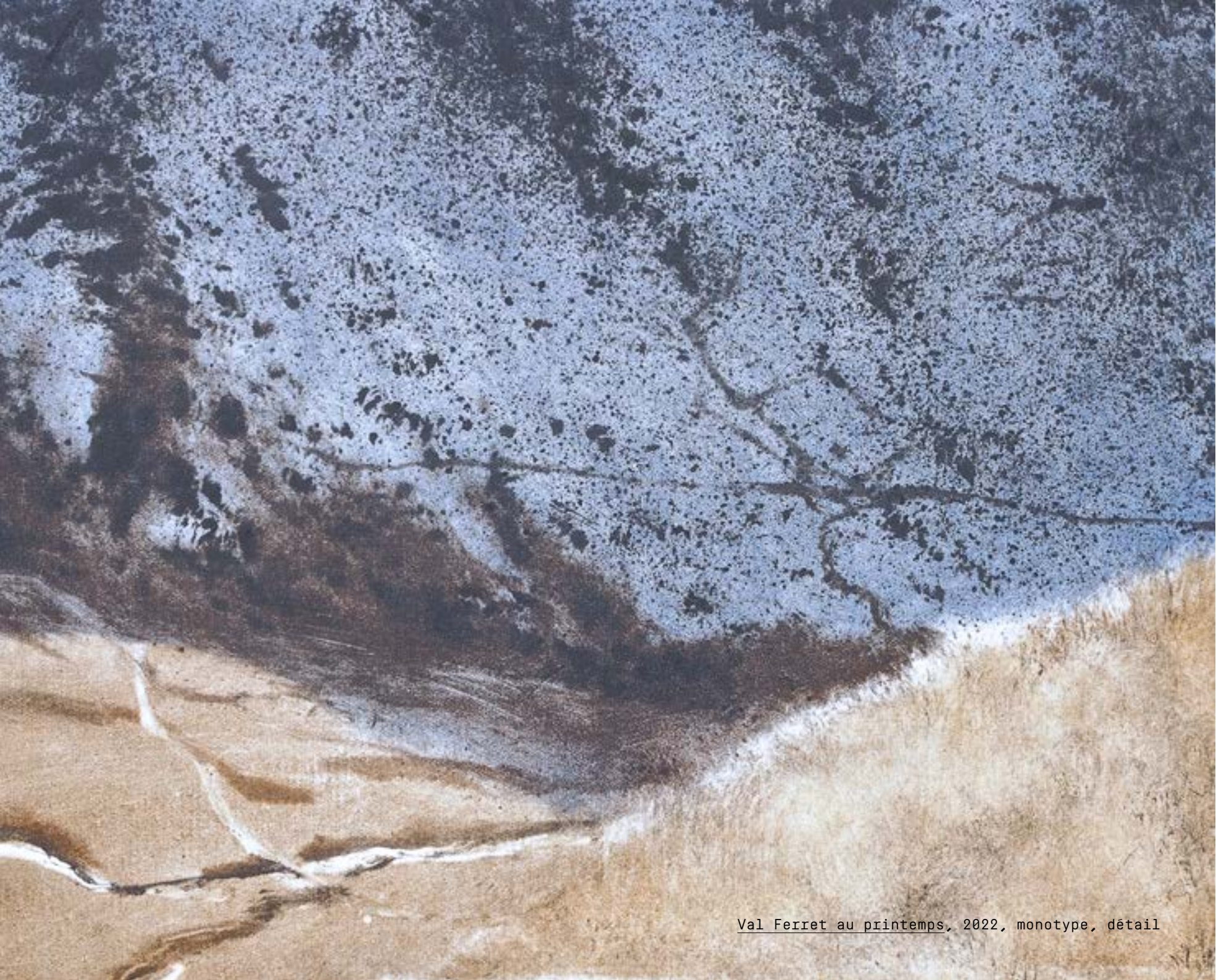
Val Ferret au printemps, 2022, monotype, détail