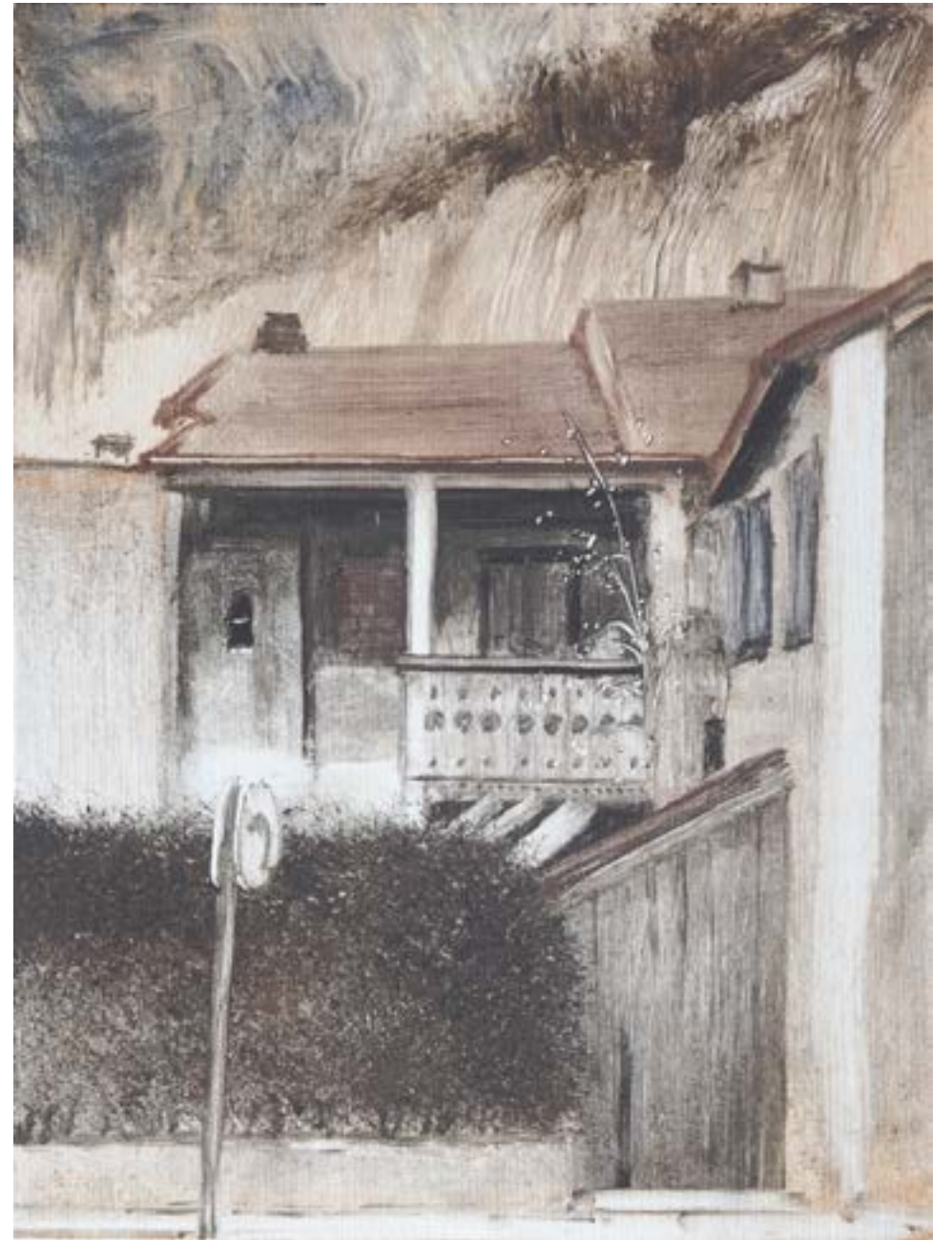
Maison à Saint-Maurice , 2022, monotype