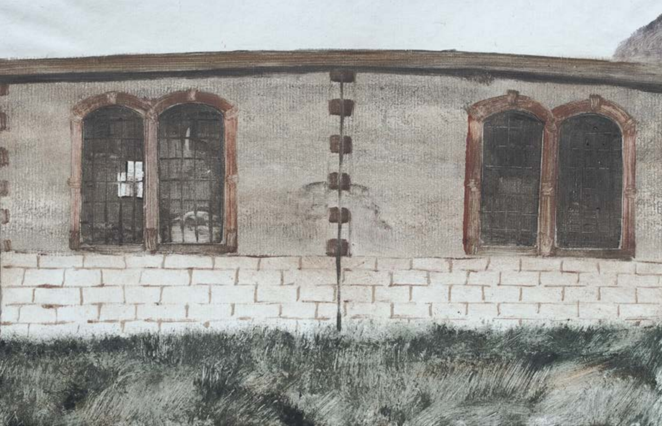
Ateliers CFF , 2022, monotype