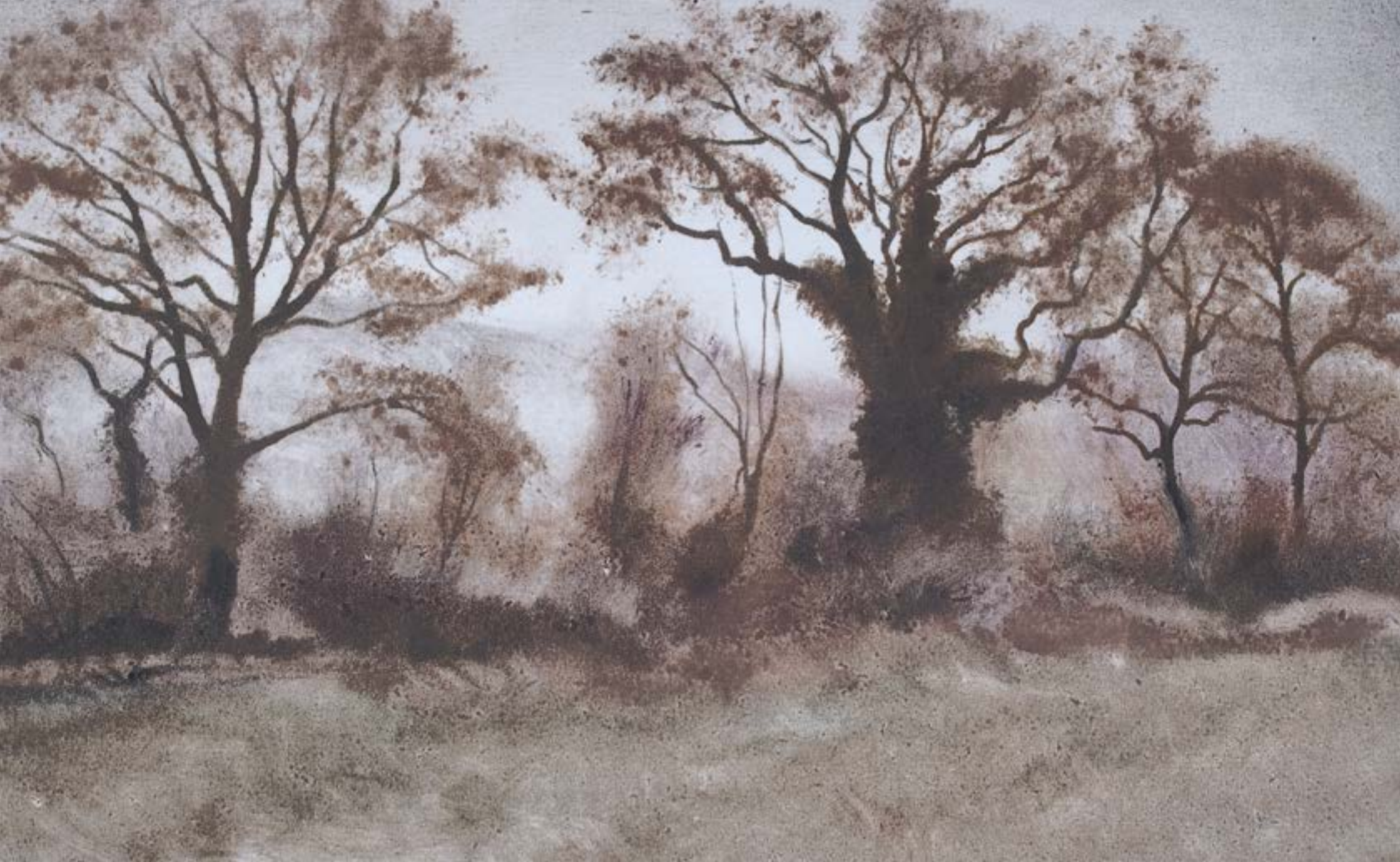
Futaie dans le Chablais , 2022, monotype