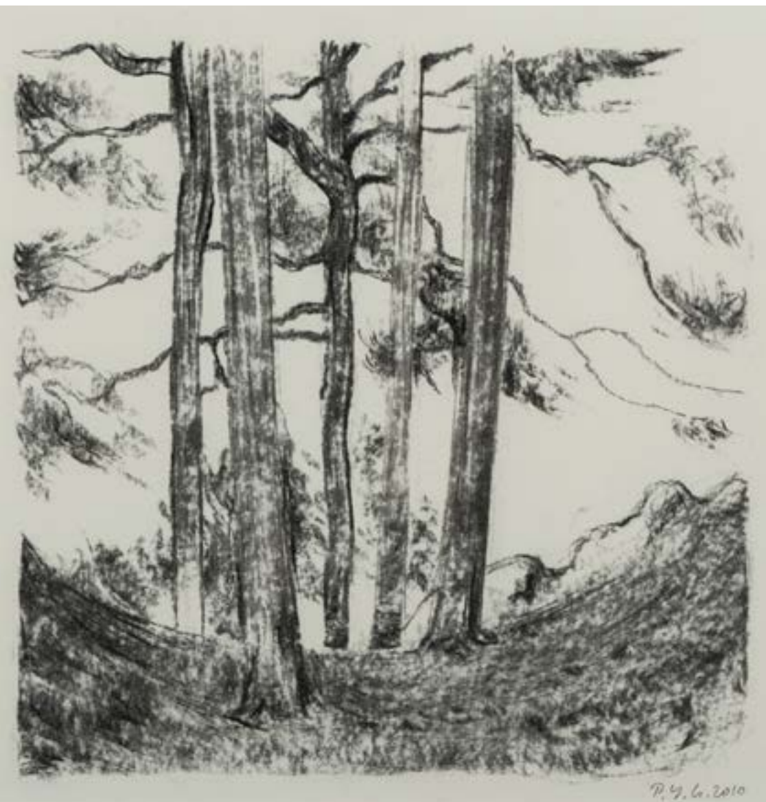
Pins à Sapinhaut , 2010, fusain