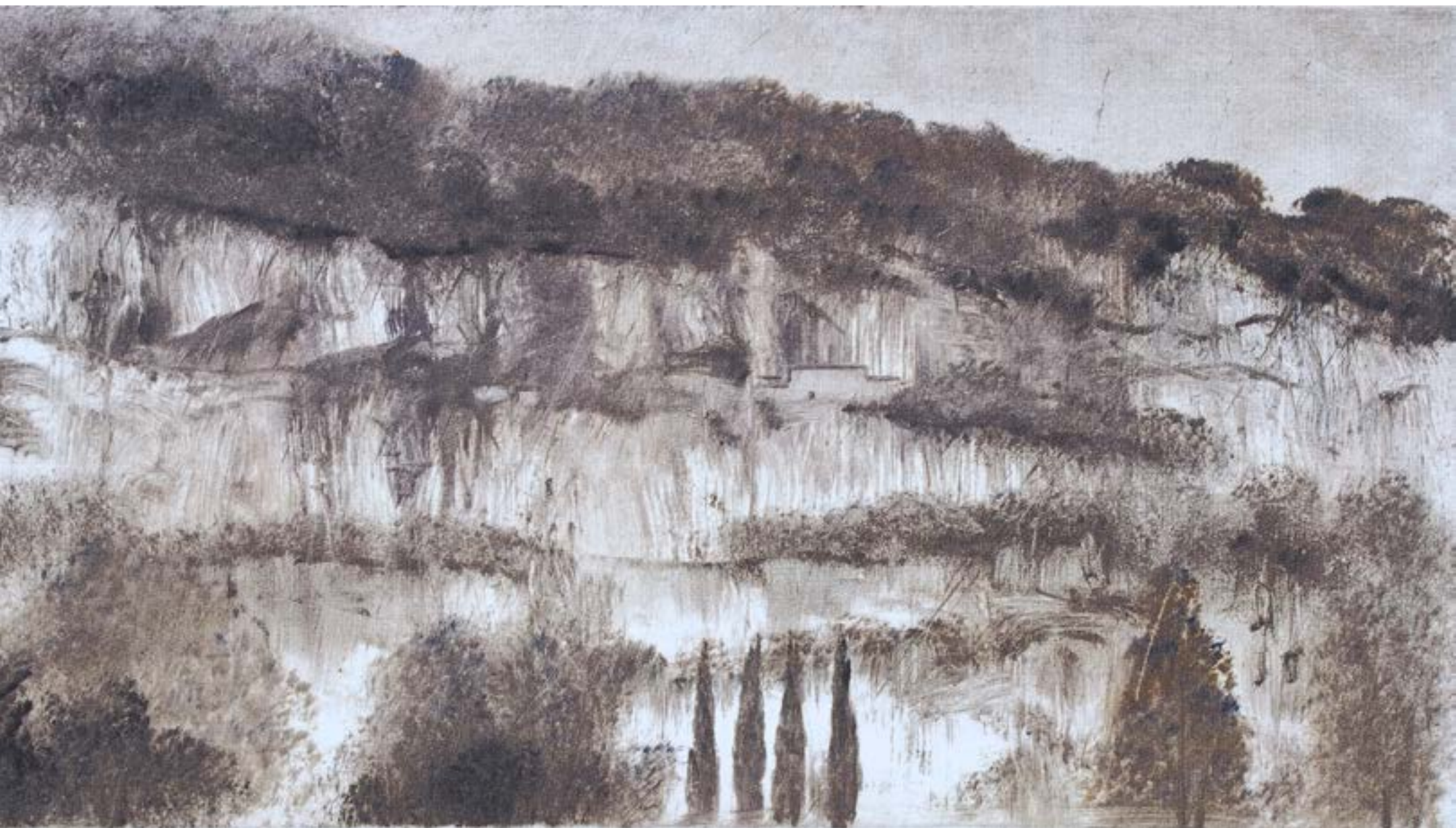
La falaise , 2022, monotype