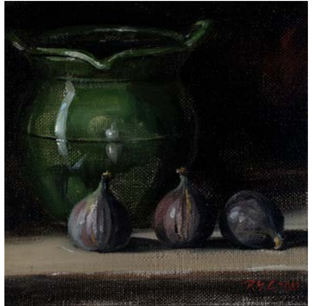
Nature morte au pot vert , 2019, huile sur toile