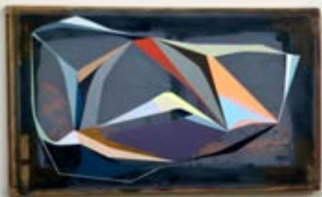
Volante VI , 2021, acrylique sur écran sérigraphique, 77x140 cm