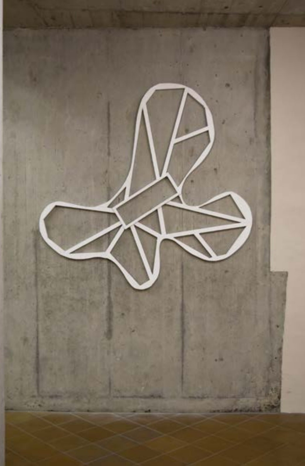
Ossa Forma, 2012, Alexandra Roussopoulos et Emmanuel Charles, acrylique sur bois, 140x145 cm