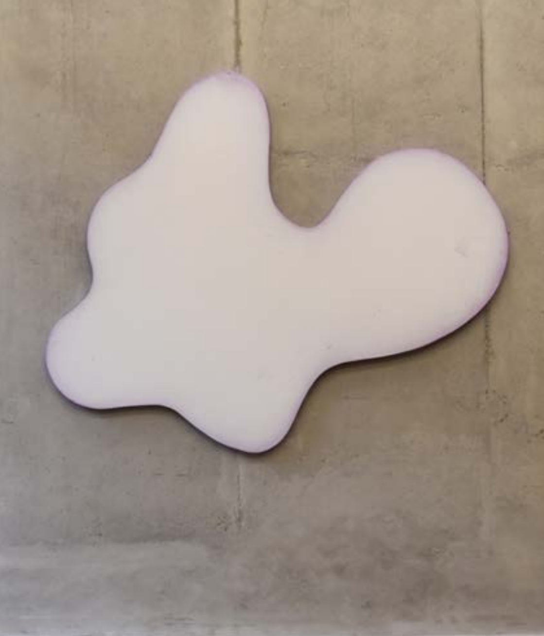
Libres et mobiles VIII , 2009, acrylique sur papier marouflé sur toile, 135x160 cm