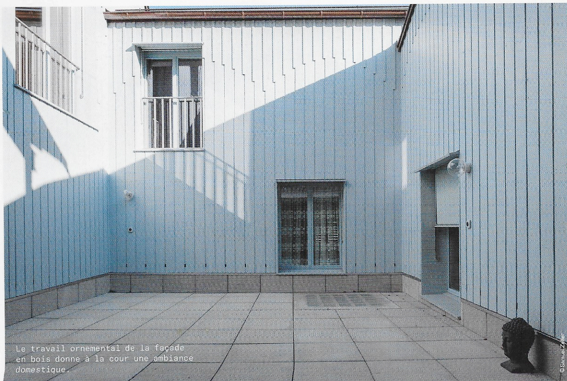
Le travail ornemental de la façade en bois donne à la cour une ambiance domestique.