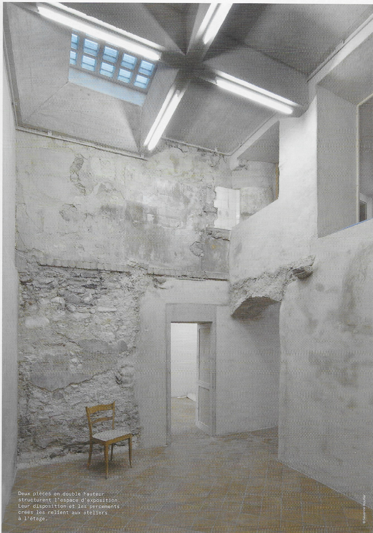
Deux pièces en double hauteur structurent l'espace d'exposition. Leur disposition et les percements créés les relient aux ateliers à l'étage.