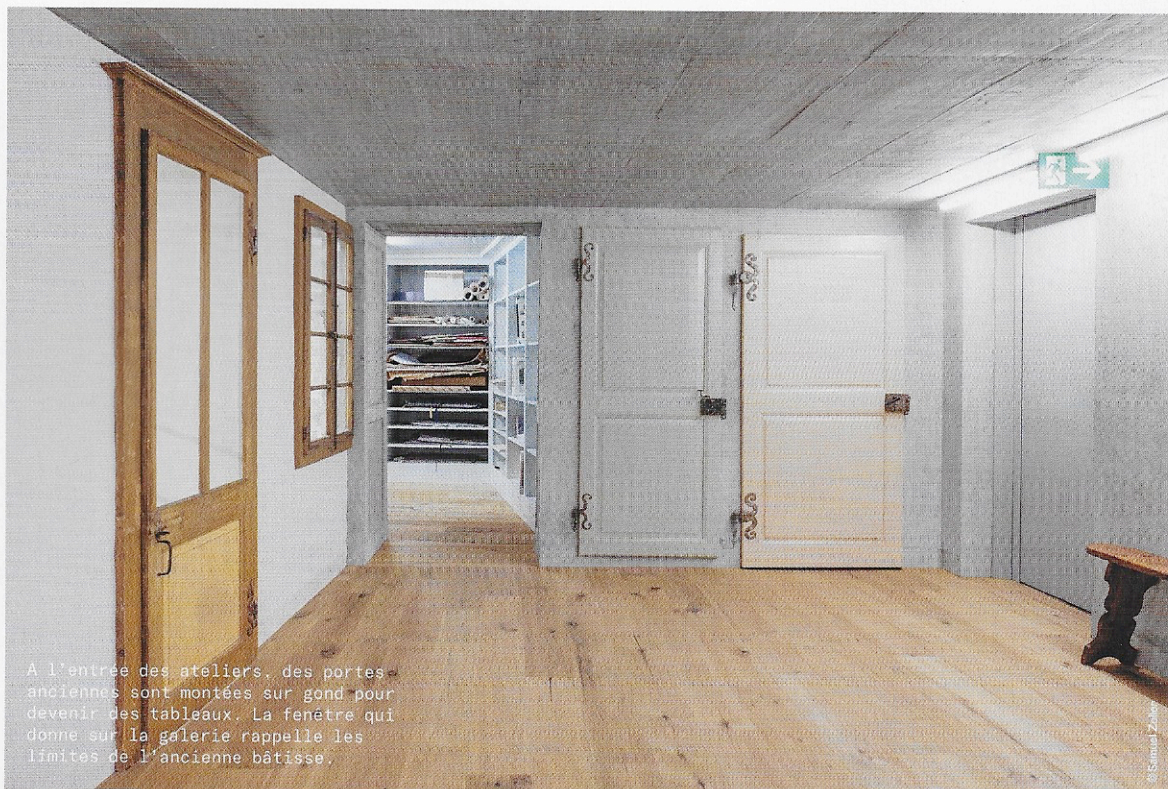
A l'entrée des ateliers, des portes anciennes sont montées sur gond pour devenir des tableaux. La fenêtre qui donne sur la galerie rappelle les limites de l'ancienne bâtisse.