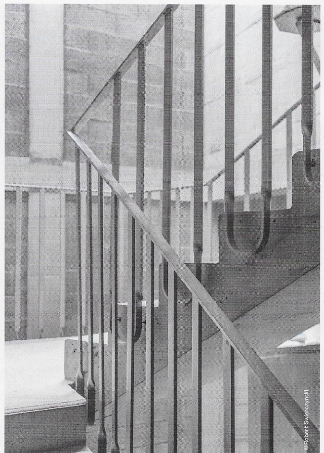
La cage d'escalier à ciel ouvert fait référence à une typologie de cour agaunoise. Le travail torsadé de la serrurerie renvoie au fer forgé traditionnel. C'est le travail du matériau qui confère au lieu son identité.

En façade, la distinction entre l'ancien et le nouveau est claire mais le rythme des ouvertures, la liberté de la composition et l'introduction d'éléments de part et d'autre viennent lier les deux en un ensemble harmonieux. Un enduit traditionnel est ainsi appliqué sur les murs rénovés, tandis que le nouveau volume affiche un béton blanc sablé dont les teintes rappellent le ton de la chaux. Un travail de surépaisseurs marque la jonction entre les deux et se poursuit en une ligne de socle qui aboutit à un angle, marqué de pierres récupérées lors de la démolition et réintroduites ici dans le béton. L'encadrement des ouvertures d'origine est réinterprété en négatif par un contour en renfoncement. Les volets sont à l'intérieur. Au centre de la baie, un meneau préfabriqué posé en fond de coffrage participe à ce jeu d'inversion qui nous renvoie au travail de la sculptrice Rachel Whiteread autour de l'empreinte et de la mémoire.